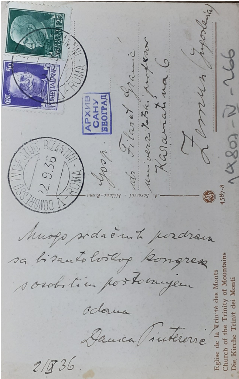
Прилог 2: Разгледница (наличје)